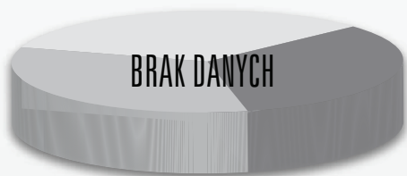
PODZIAŁ SPRZEDAŻY W ROKU 2015